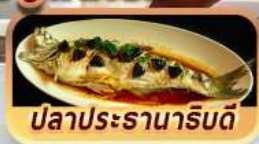
ปลาประรานาภิรมดี