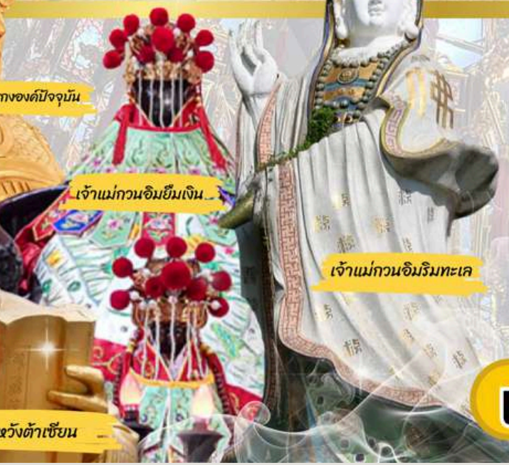
เจ้าแม่กวนอิมยืมเงิน