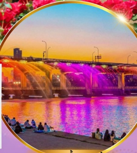
ชมสะพานน้ำพุสายรุ้ง

เซคอินเกาหลี สุดโรแมนติก ชมศิลปะดิจิทัลสุดล้ำ บนจอ LED เสมือนจริงขนาดยักษ์ สนุกสุดมันส์ สวนสนุกล็อตเต้เวิลด์ ชมต้นจูนีเปอร์เงินอายุกว่า 1,000 ปี และดอกไม้ตามฤดูกาล อิสระช้อปปิ้ง เมียงดง ช้อปปิ้งปลอดภาษี Lotte Duty Free