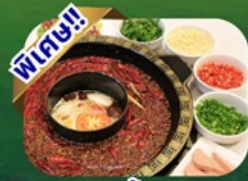
เมนูสุกี้หมาล่า

พักโรงแรม 4 ดาว ★★★★★ ฟรี ประกันอุบัติเหตุ บริการ อาหารท้องถิ่น