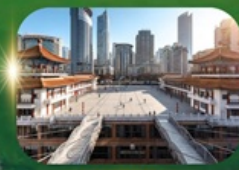
ตึกหุยซิง

อุทยานแห่งชาติหลุมฟ้าสะพานสวรรค์ ระเบียงกระจก อุทยานเขานางฟ้า ใต้เจียเซียง ห้างการ์เด็นควางหวน พระพุทธรูปแกะสลักหิน หมู่บ้านโบราณฉือชี่ไช่ ชมรถไฟฟ้าทะลุตึก ตึกหุยซิง ตึกตะเกียบ ถนนคนเดินเจียฟางเป่ย์ ล่องเรือแม่น้ำแยงซีเกียงวิวคำคิน อิสระช้อปปิ้งหงหยาดัง