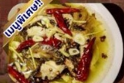
ปลาต้มพริกทอด