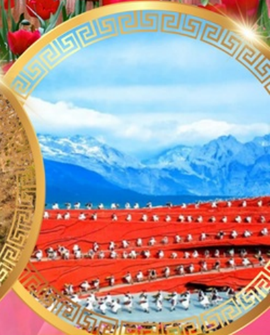
ความประทับใจแห่งลี่เจียง