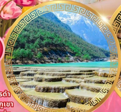
ทะเลสาบไป๋สยเหอ

วัดชงจ้านหลิน ช่องแคบเสือกะโจน สระมังกรดำ เมืองโบราณลีเจียง ภูเขาหิมะมังกรหยก ชมวิวภูเขา หิมะที่ร้าน Yun di ta ชมดอกไม้ที่สวนอุทยานชุ่ม น้ำโกวหนาน ชมดอกซากุระสวนหยวนทง