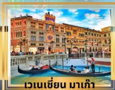
เวเนเชียน มาเก๊า