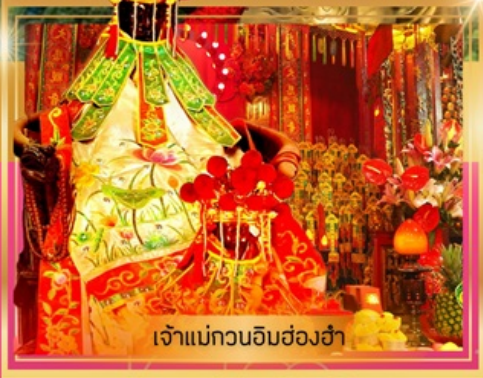
เจ้าแม่กวนอิมฮ่องฮั่ว