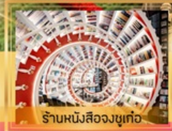
ร้านหนังสือจงซูเก๋