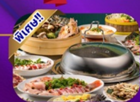
ซุฟไฟต์ซาบู