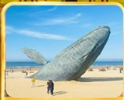
ประมาติกรรมวาฬเพชฌัญชี่