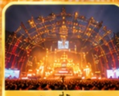
สถานที่จัดงาน เทศกาลเบียร์ชิงเต่า