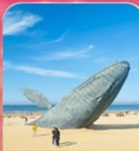
ประติมากรรม "วาฬผู้โดดเดี่ยว"