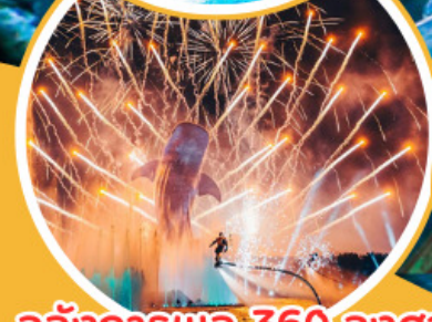
อลังการพลุ 360 องศา