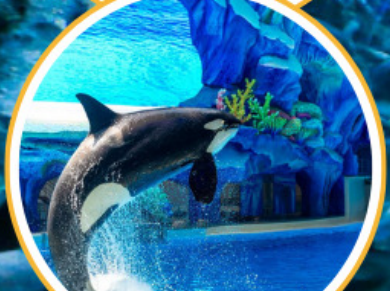
Orea Show สุดน่ารัก