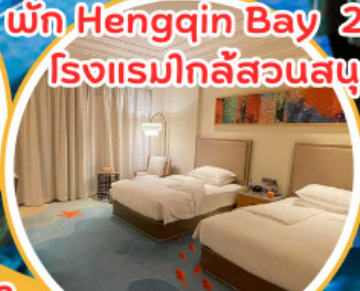
พัก Hengqin Bay 2 คืน!! โรงแรมใกล้สวนสนุก