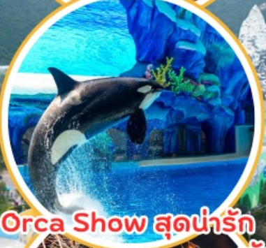
Orca Show สุดน่ารัก