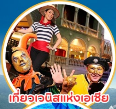
เกี้ยววณิสแห่งเอเชีย