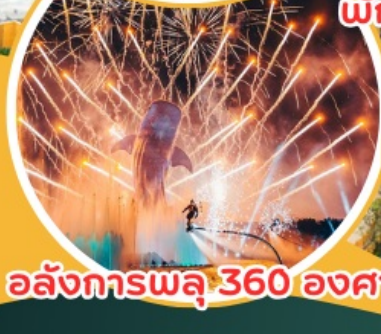
อลังการพลุ 360 องศา