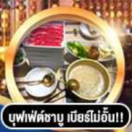
บุฟเฟ่ต์ชาบู เบียร์ไม่อั้น!!