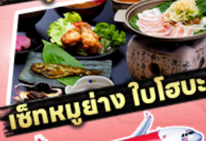
เช็กเมนูอย่าง ใโปะ

29,919 ราคาเริ่มต้น บาท รวมภาษีมูลค่าเพิ่ม 7%