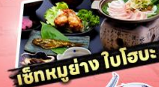
เช็กเอาท์ ใโฮะ