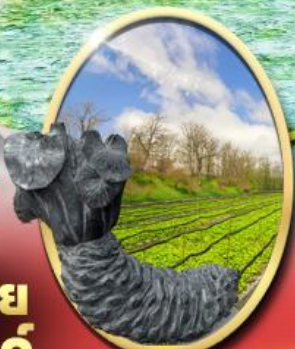
ฟาร์ม วาซาบิ ไดโอะ

รหัสทัวร์ RJ-XJ121 เดินทาง 6D 4N เมษายน - มิถุนายน 69