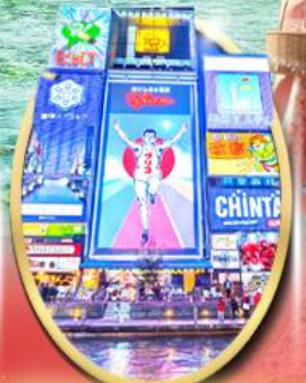
ซ็อบบิง ซินโซบาชิ