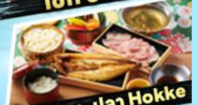
เซ็ทซาซิมิ + ปลา Hokke