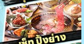
เซ็ท บิงย่าง