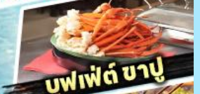
บุฟเฟต์ ซาปู