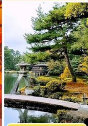
สวนเคนโระคุเอ็น

ออนเซ็น 3 คั้น นน.กระเป๋า 23 กก. 7Days 5Night