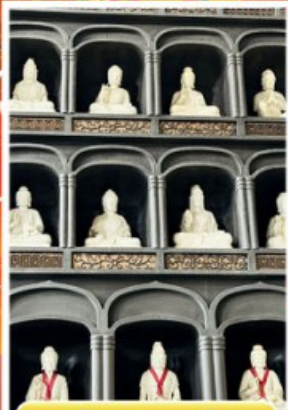
วัดไดชิซังเซโด้จิ