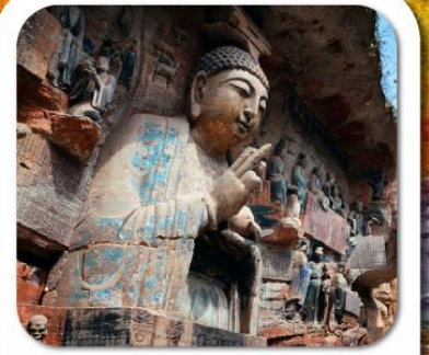
"พาสินแกะสลักต้าจู้"