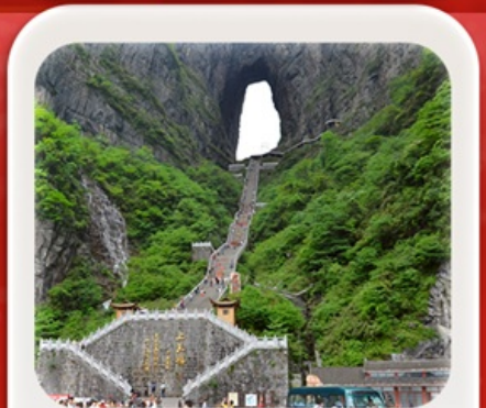
"กำประตูสวรรค์"