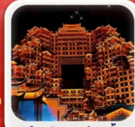
"ดึกมหัศจรรย์ 72 ชั้น"