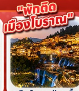
"เมืองโบราณฟู่หลงเจิ้น"