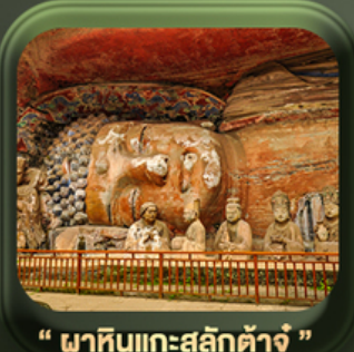
“ พาคินแกะสลักต้าจู้ ”

วันเดินทาง มี.ค. - ต.ค.2569 ราคาเริ่มต้น 22,999.-