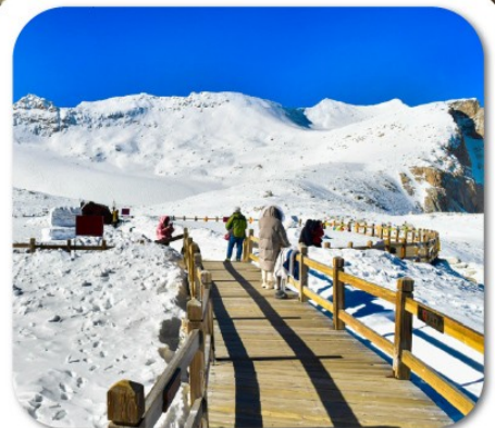
"ต้ากู่กลาเซียร์"

เที่ยวชมความงาม 3 อุทยานชื่อดัง : สี่ดรุณี • ปี่เฟิงโกว ต้ากู่กลาเซียร์ ชมความน่ารักของหมีแพนด้า • จัตุรัสหยางเทียนวู่ ชอยกว้างชอยแคบ • ถนนคนเดินซุนซีลู่ • POP MART