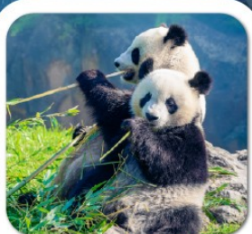
"ศูนย์หมีแพนด้า"