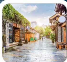
"ชอยกว้างชอยแคบ"