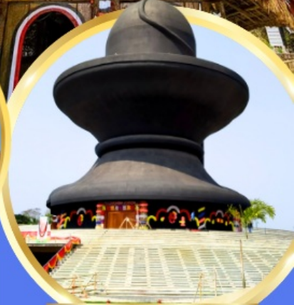
วันมหาฤตยูชัย