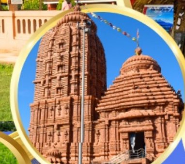
เทวาลัยศรีจักรนารท แห่งดีบุรการ์ห์