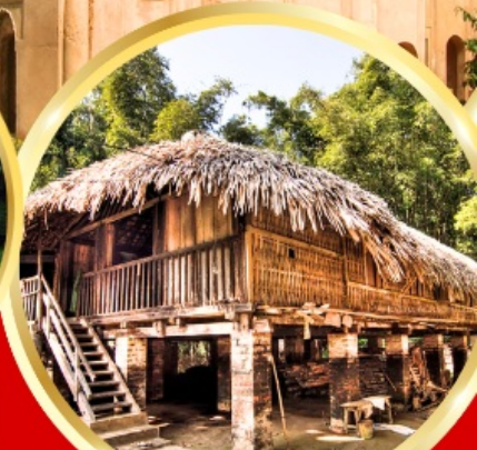
หมู่บ้านไทพาทะ