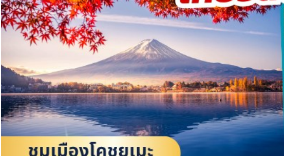
ชมเมืองโคชูยูเมะ