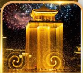
ชมโชว์อุ๊หนี่โจว