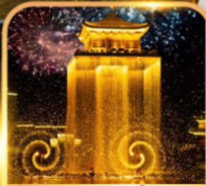
ชมโชว์อุหนี่โจว