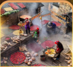
หมู่บ้านโบราณหวงหลิง