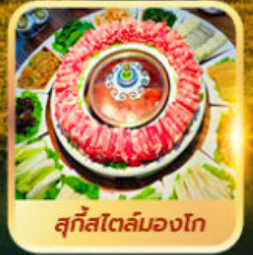
สุกีสโตล์มองโก