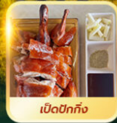
เปิดปีกถึง