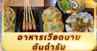
อาหารเวียดนาม ดันตำรับ