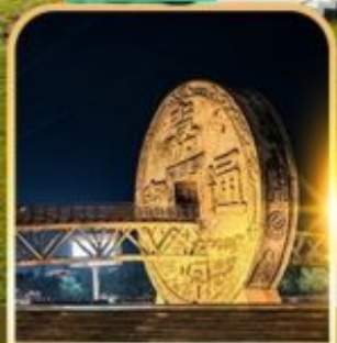
จัตุรัสเหรียญโบราณ