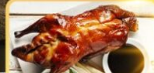
เปิด Four Season