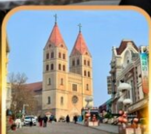
โบสถ์เซ็นต์ไมเคิล