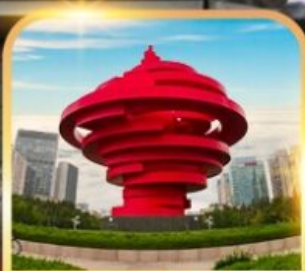
จตุรัสหาลี้