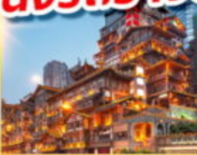
หงหย่าต้ง