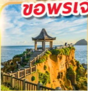
เกาะเหอผิง

พักย่านซีเหมินติง 2 คืน ขอพรเจ้าแม่กวนอิมพันมือ