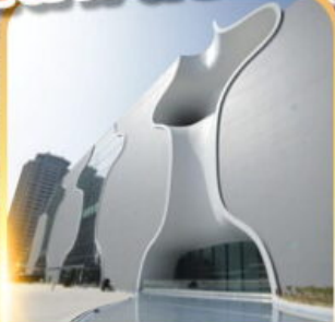
โรงละครโดจง