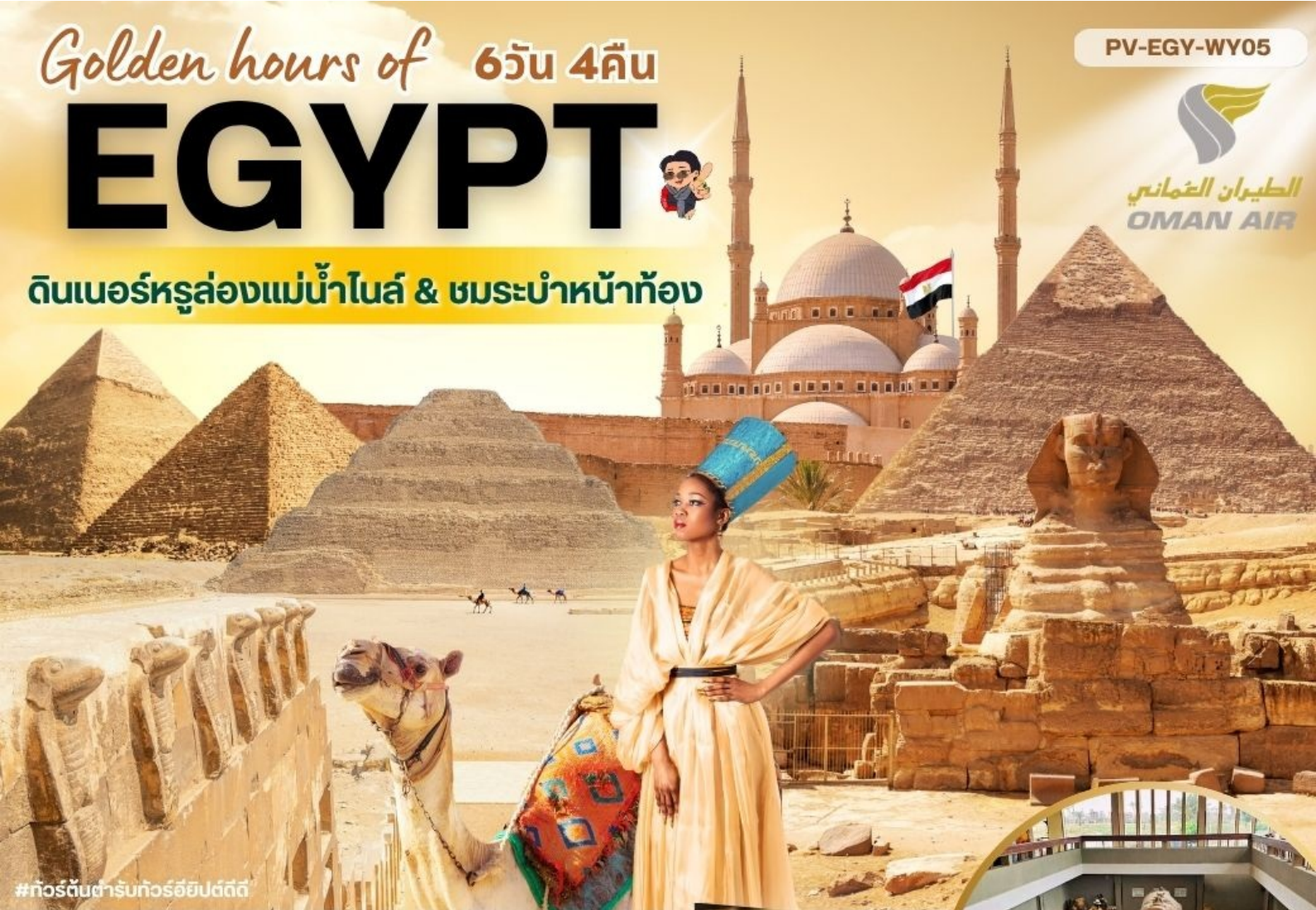
#ทัวร์ต้นตำรับทัวร์อียิปต์ดี

ดินเนอร์หล่องแม่น้ำไนล์ & ชมระบำหน้าห้อง