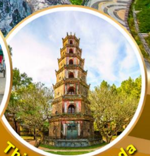
Thien Mu Pagoda