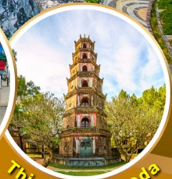
Thien Mu Pagoda