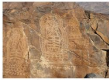
เมืองชิลาส

** พักที่ Shangrila Chilas Hotel หรือเทียบเท่า **