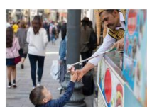
ไอศกรีม Maraş ชมพระอาทิตย์ตกดิน ณ ภูเขาเนมรุต