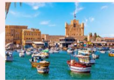
เมืองอเล็กซานเดรีย