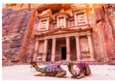
เมืองเพตรา