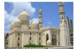
Abu Al-Abbass Al-Mursi