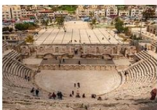
โรงละครโรมัน