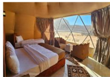
นอนแคมป์ Bubble Dome

** พักที่ Luxury Wadi Rum Magic Bubble Dome 4* หรือเทียบเท่า **