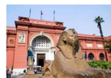
The Egyptian Museum

** พักที่ Saray Pyramids & Museum View Hotel 4* หรือเทียบเท่า **