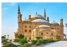
ป้อมปราการแห่งไคโร