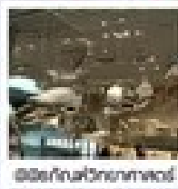
เมืองโบราณอูเจิ้น