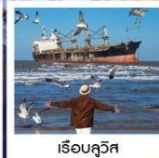
เรือลิวอิส