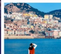
หาดซาจื่อฮั่ว