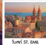
โบสถ์ ST. EMIL