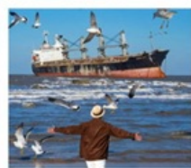
เรือลิวอิส