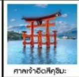
ศาลเจ้าอิตสึกิชิมะ