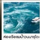
ช่องเรือชนน้ำวนนารุโตะ