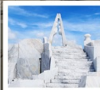
วัดโคซันจิ