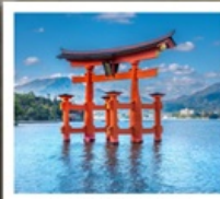
ศาลเจ้าอิตสึคุชิมะ