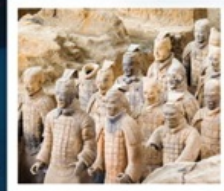
พิพิธภัณฑ์กองทัพใต้ดิน

หมู่บ้านถ้ำเอ๋อเป้อ / อุทยานอวิ้นชิวชาน (รวมรถแบตเตอรี่) ถ้ำน้ำแข็งอวิ้นชิวชาน / อุทยานอวิ้นชิวชาน / น้ำตกหูชิว (รวมรถแบตเตอรี่) ที่ทำการประธานเหมา / แกรนด์แคนยอนยูดาโกว (รวมรถแบตเตอรี่) ถนนคนเดินวัฒนธรรมต้าถิง / กำแพงเมืองโบราณซีอาน / เจดีย์ห่านป่าใหญ่ พิพิธภัณฑ์กองทัพใต้ดินทหารม้าจีนซี (รวมรถแบตเตอรี่)