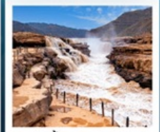
น้ำตกหูชิว