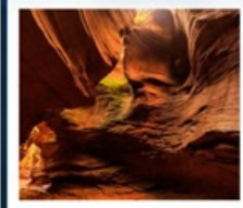
แกรนด์แคนยอนยูดาโกว