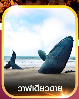
วาฬเดี่ยวตาย

✈️ คอนเฟิร์มออกเดินทาง ✈️ ทุกพีเรียด 2 ท่านขึ้นไป