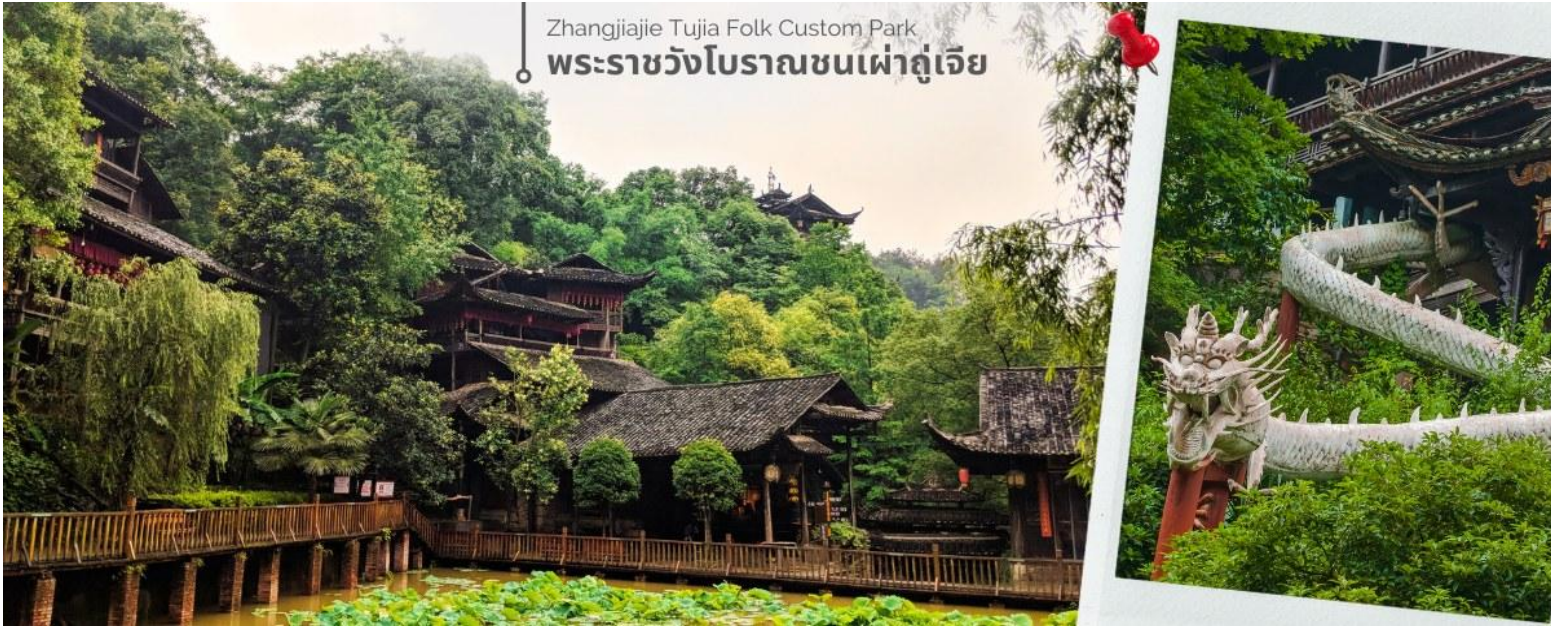
Zhangjiajie Tujia Folk Custom Park พระราชวังโบราณชนเผ่าตู่เจีย

นำทุกท่านเดินทางสู่ พระราชวังโบราณของชนเผ่าตู่เจีย เป็นสถานที่ท่องเที่ยวที่สำคัญในเมืองจางเจียเจีย ประเทศจีน ซึ่งเป็นที่อยู่อาศัยของชนเผ่าตู่เจีย. ภายในพระราชวังมีการแสดงวิถีชีวิต พิธีกรรม และวัฒนธรรมของชนเผ่าตู่เจีย. นอกจากนี้ยังมีอาคาร 9 ชั้นที่สร้างจากไม้ ซึ่งเป็นที่พำนักของเจ้าเมืองในอดีต ซึ่งปัจจุบัน สามารถขึ้นไปชมได้ แต่แต่ละชั้นจะมีแสดงเสื้อผ้าของใช้ของฮ่องเต้ รวมถึงของพื้นเมืองให้เราดู ด้านบนสุดเห็นวิวเมืองด้วย สวยงาม และด้านหลังยังมีอาหารใหม่ที่สร้างหลังอาคารใหญ่ๆ จะมี 2 อาคาร มีป้อน้ำตามีหลักฮวงจุ้ย