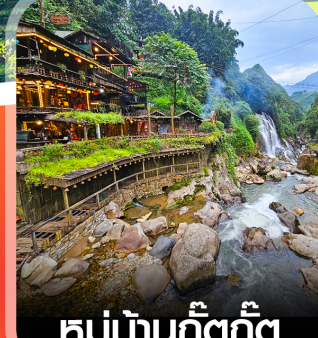
หมู่บ้านก๊ต๊ก๊ต