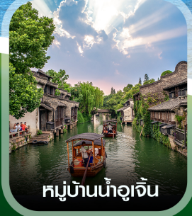
หมู่บ้านน้ำอู๋จิ้น