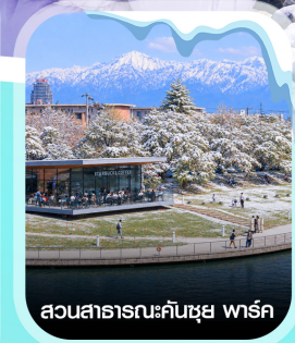
สวนสาธารณะคินซุซุ พาร์ค