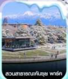
สวนสาธารณะคันซุย พาร์ค

✈️ คอนเฟิร์มออกเดินทาง ทุกพีเรียด 2 ท่านขึ้นไป