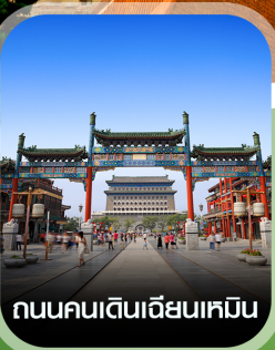
ถนนคนเดินเฉียนเหมิน