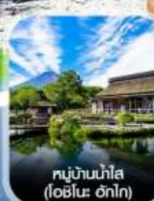
หมู่บ้านน้ำใส (โอชิโนะ ฮักไก)