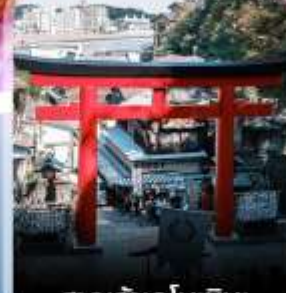
ศาลเจ้าเอโนะชิมะ