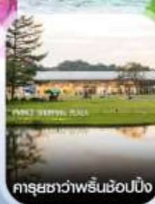
คารุยชาว่าพริ้นช้อปปี้ง