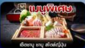
เมนูพิเศษ เซตซาบู ซาบู สไตล์ญี่ปุ่น

โตเกียว-ฟูจิ-คามิโคจิ-ทะเลสาบคาวากุจิโกะ-หมู่บ้านน้ำใส-เมืองเก่าคาวาโกเอะ-คารุยชาว่า-อึสะซ้อปปี้งเต็มวัน