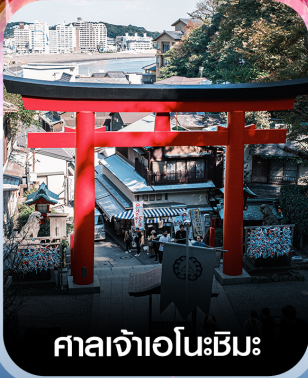
ศาลเจ้าอินะชิมะ