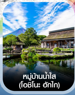
หมู่บ้านน้ำใส (โอชิโนะ อักไก)

✈️ คอนเฟิร์มออกเดินทาง ทุกพีเรียด 2 ท่านขึ้นไป