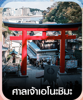
ศาลเจ้าเอโนะชิมะ