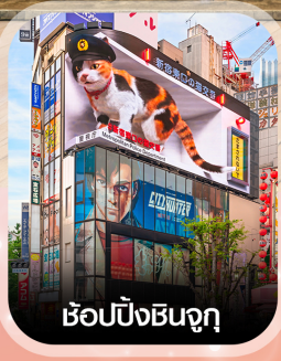
ช้อปปังชินจูกุ