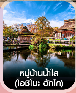
หมู่บ้านน้ำใส (โอะชิโนะ อักโก)

✈️ คอนเฟิร์มออกเดินทาง ทุกพีเรียด 2 ท่านขึ้นไป